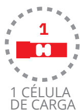
1 CÉLULA DE CARGA