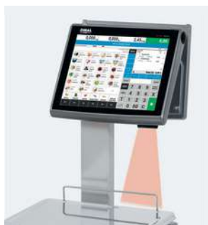
> Escáner integrado en la balanza.