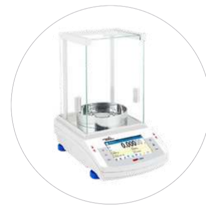
Balanzas de laboratorio