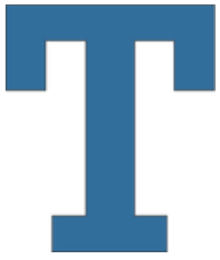
Tabla de Alcance