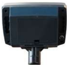
Adaptador columna incluido