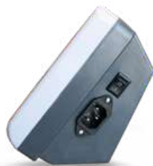
Fuente de alimentación