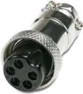
DIM 5 pines hembra