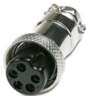
DIM 5 pines hembra