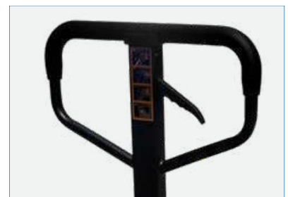
MANILLAR ERGONÓMICO DE FÁCIL MANEJO

Diseño y acabado de calidad para un manejo fácil. Pintura al polvo para máxima duración. Fácil funcionamiento con indicador multifunción y pantalla LCD.