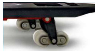
ALTURA MÁXIMA DE 205 mm