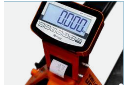
INDICADOR INTEGRADO CON PROTECCIÓN *Versión con impresora